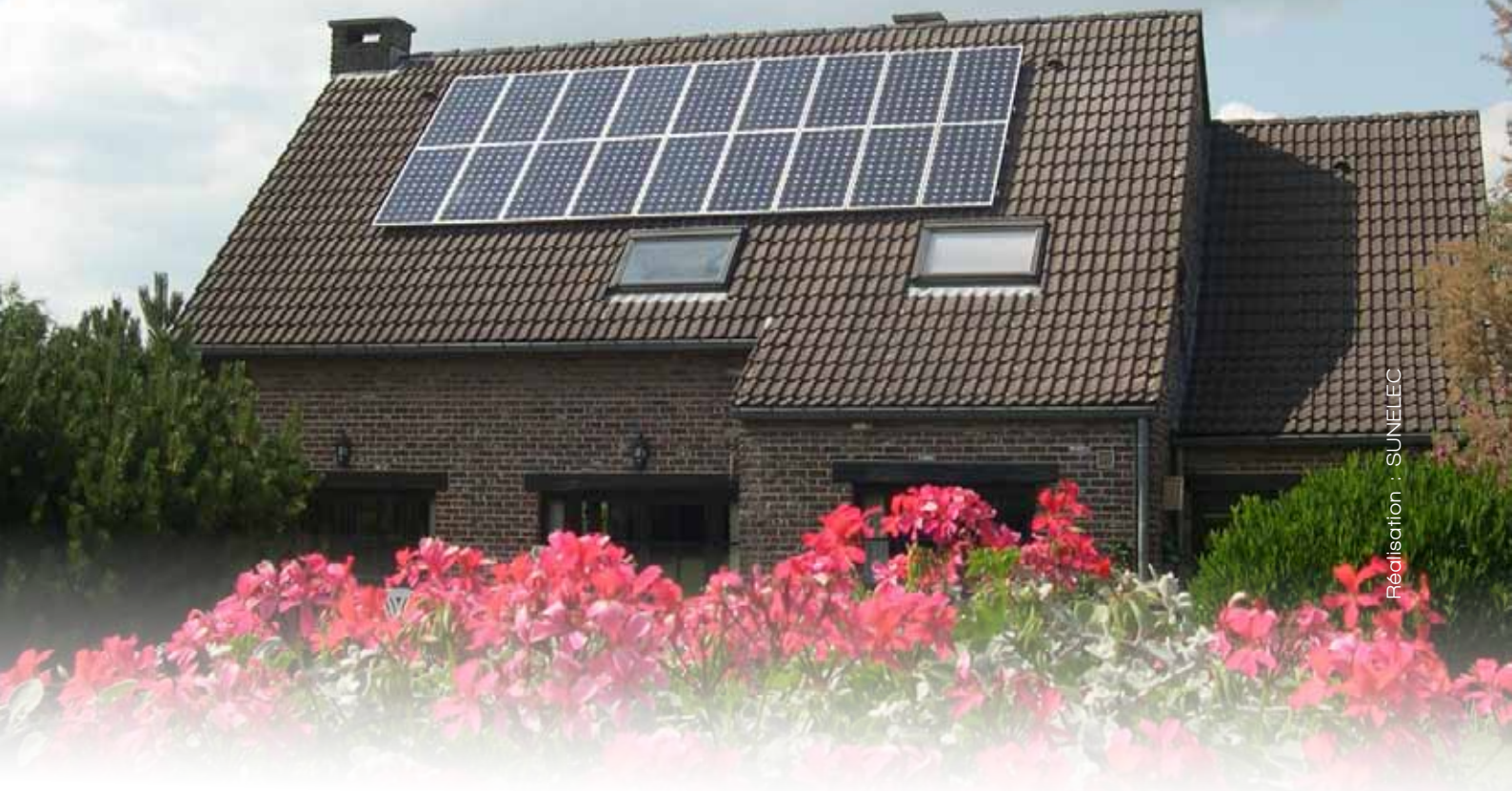
Réalisation : SUNELEC

et obtenir un avis éclairé sur votre projet, donc un devis. Contacter plusieurs installateurs est recommandé. Cette sélection peut s'opérer sur base des renseignements pris auprès de personnes qui ont une installation en fonctionnement ou encore avec l'aide des listes des professionnels accessibles sur http://www.pvqual.be et http://energie.wallonie.be . Sur le site www.ef4.be , vous accéderez aussi gratuitement à des informations sur plus de 4300 installations répertoriées en Wallonie (PV database).