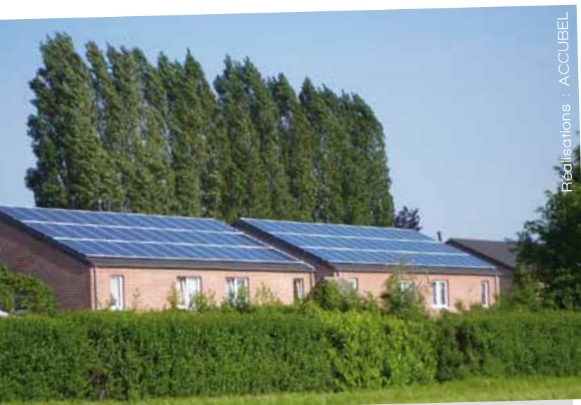
Réalisations : ACCUBEL

Pour la première fois de son histoire, le photovoltaïque est devenu la locomotive des énergies renouvelables en Europe. Entre 2009 et 2010, sa progression a été d'un peu plus de 120%. La puissance installée dans l'Union